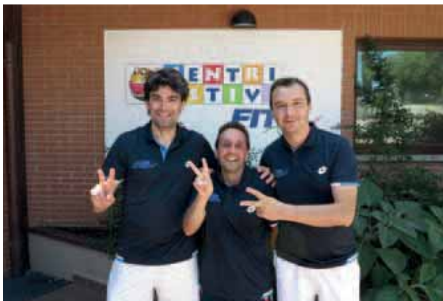
Foto ricordo dei giocatori del Tc C10 all'entrata del centro sportivo