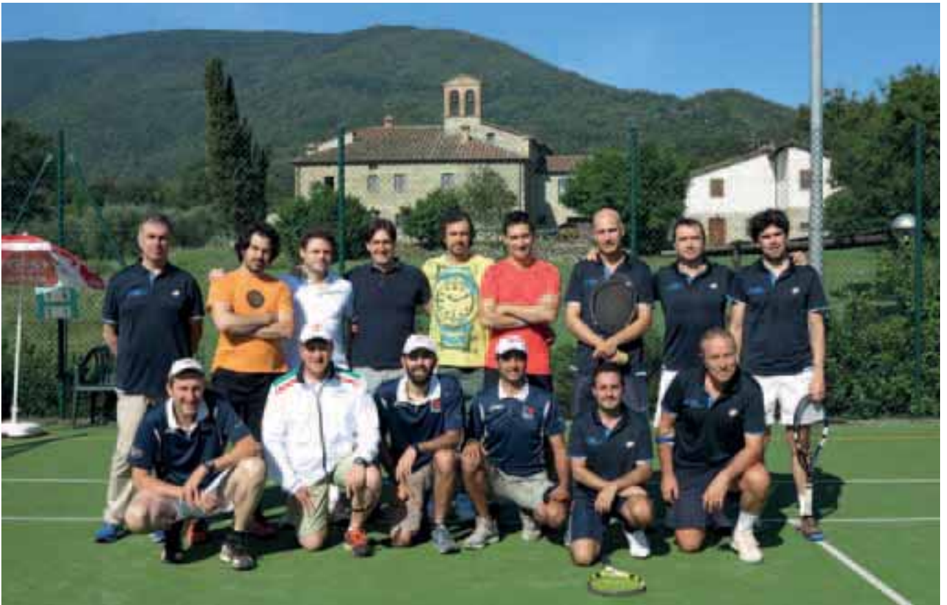
Le squadre che hanno dato vita alla 6ª edizione del Trofeo Michelangelo