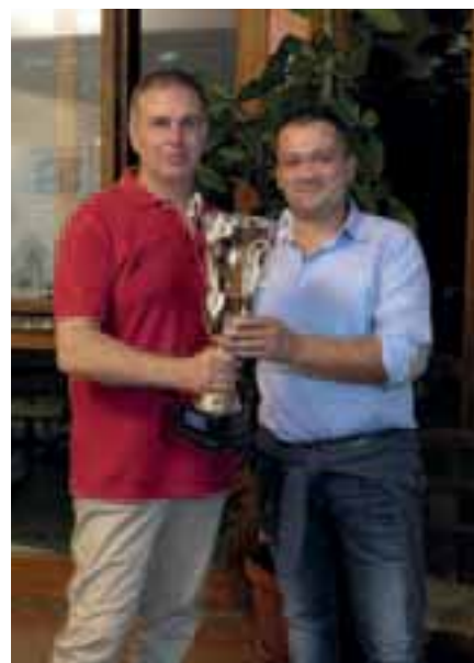
La consegna del trofeo al Tc C10